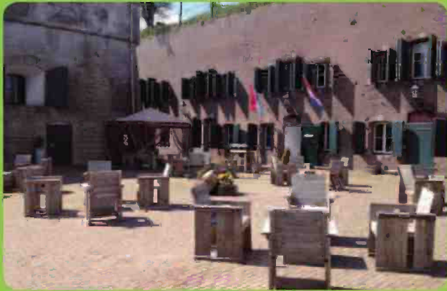
Fort Prins Frederik, Ooltgensplaat