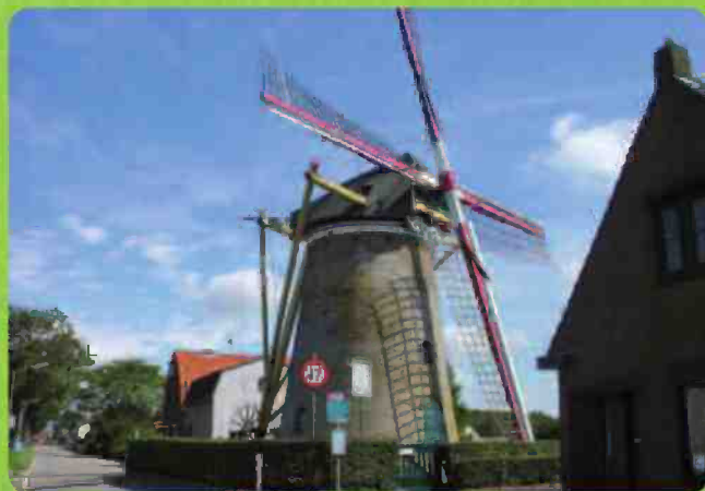
Molen "De Korenaer", Stad aan 't Haringvliet

Neem een kijkje in molen "De Korenaer", een grondzeiler/korenmolen uit 1746.