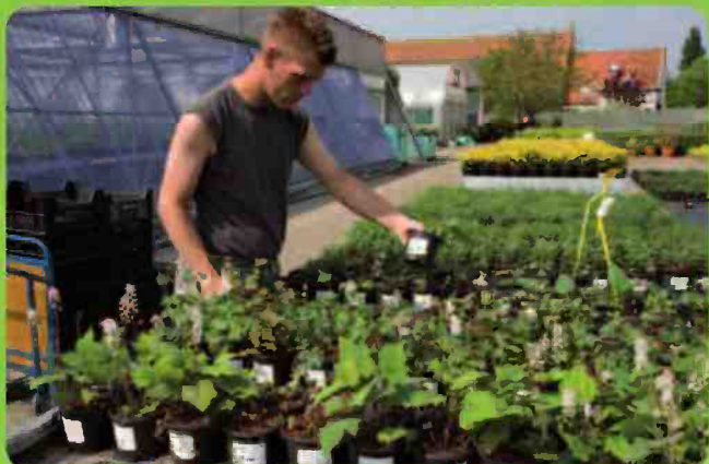
De Nollestee, Melissant