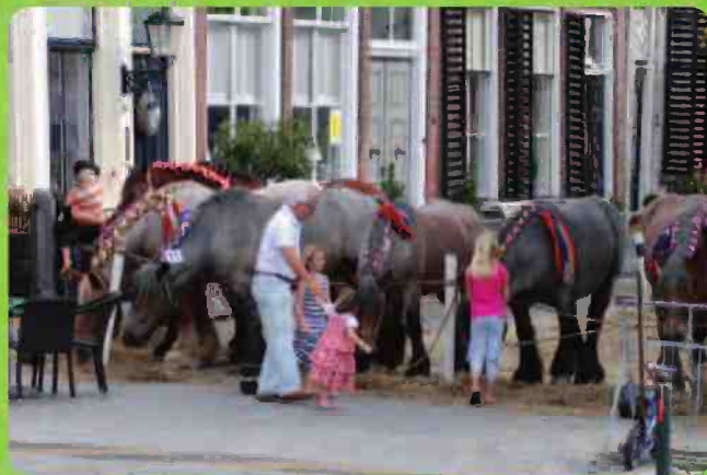
"Versierde paarden" bij de haven van Goedereede

Neem een kijkje in molen "Korenlust", een ronde stenen stellingmolen uit 1856.