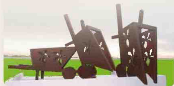
Ontwerp kunstwerk bietenstort Dirksland

In het najaar van 2012 worden in Dirksland en Middelharnis ook kunstwerken onthuld die relateren aan de haven: Jaap Reedijk vertelt over de tweelingbroers Boomsma, die vanuit Middelharnis over de gehele wereld reisden en in Dirksland verbeeldt Michel Snoep de bietenstort.