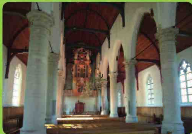
Hervormde kerk Dirksland

Neem een kijkje in molen "de Eendracht", een stellingmolen/korenmolen uit 1846.